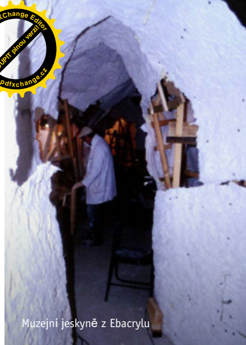
Muzejní jeskyně z Ebacrylu