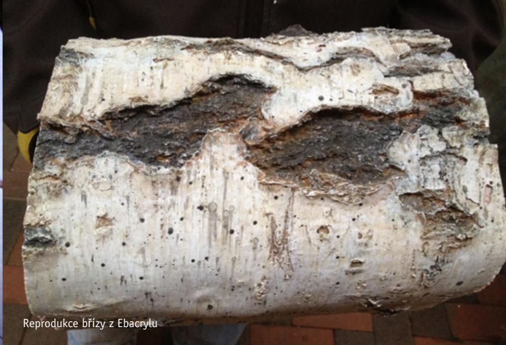
Reprodukce břízy z Ebacrylu