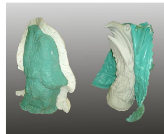
Sádrová reprodukce vyrobená z ebacrylové skořepiny a silikonové kůže