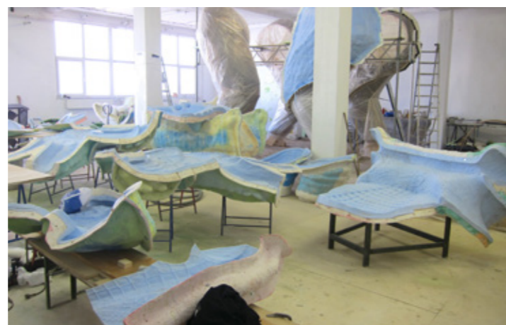
Výrobní formy z Ebacrylu na dračí kůži o hmotnosti přibližně 1.000 kg, která byla vyrobena z epoxidové pryskyřice AH 140.

Ebacryl je založen na vodní bázi a přitom bez škodlivých látek, šetrný k životnímu prostředí a bez zápachu. Nástroje lze čistit vodou. Ebacryl splňuje požární předpisy třídy B1 a je proto vhodný např. pro stavbu kulís.