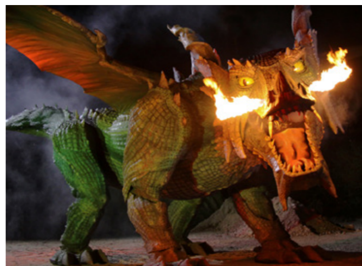
Ohnivzdorná dračí hlava je laminována z Ebalta epoxidové pryskyřice LH 25 a testována podle DIN 5510-2 (třída hořlavosti S 4)

Například pro odlitek a výrobu dračí kůže Tradinno. Ohnivý drak z Furth im Wald je asi 16 metrů dlouhý a je nejčtější čtyřnohým robotem na světě v Guinnessově knize rekordů.