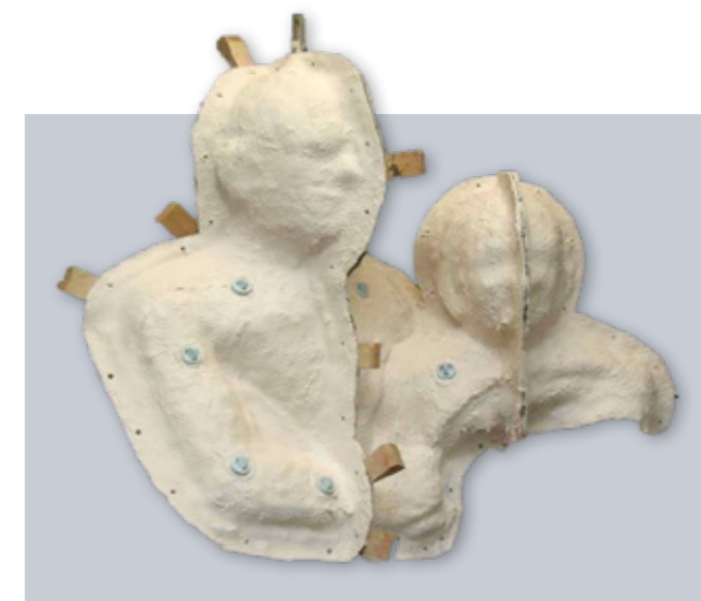
Nosná skořepina z laminátového systému Ebacryl