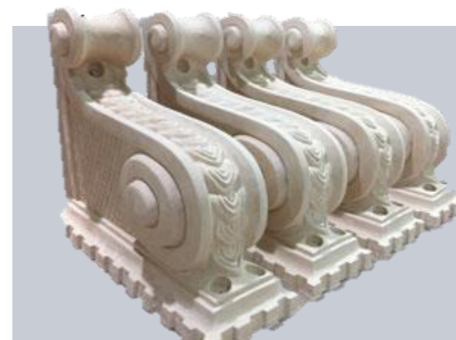
Malosériová výroba z ebacrylové výrobní formy