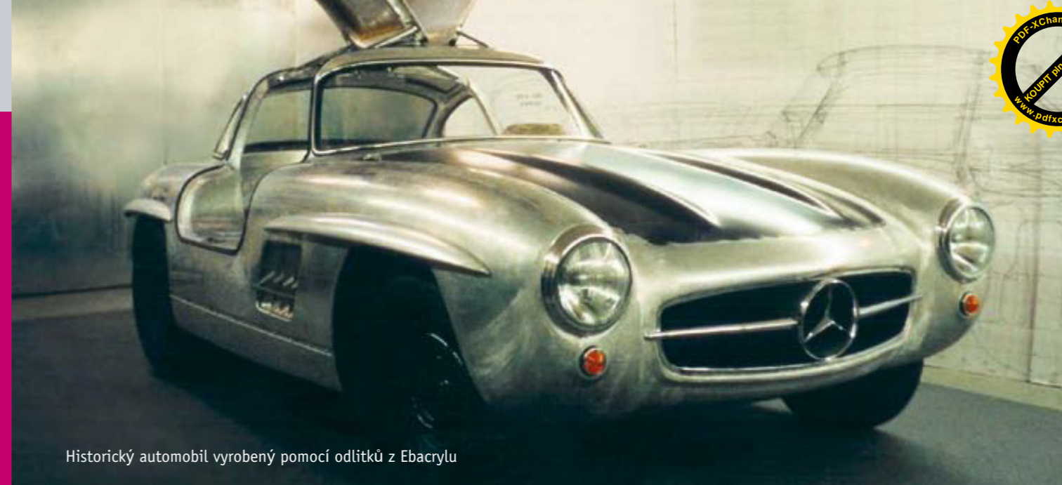
Historický automobil vyrobený pomocí odlitků z Ebacrylu