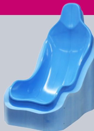
Mateční model z Ebaboardu EP 138 k výrobě prepreg nástroje na závodní sedadla